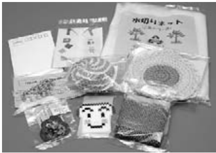
昨年の障害者週間で配布された啓発物品

とき 12月3日(土)、午前11時～ ところ イオンラパークショッピングセンター、ジャスコ伊勢店、ピアゴ上地店、伊勢みそのショッピングセンター、ベリー小俣店、プライスカット伊勢二見店、ミタス伊勢